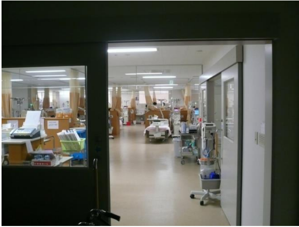
人工透析センター