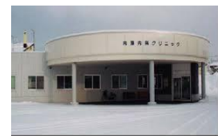
内海内科クリニック