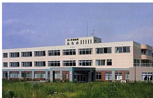
介護老人保健施設ふらの