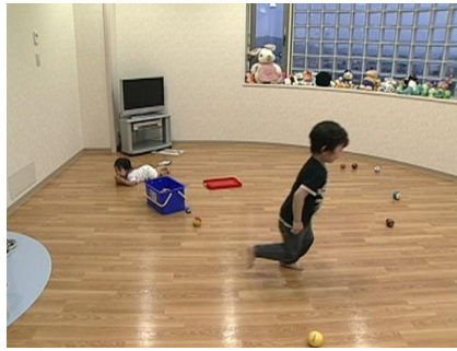
小児科プレールーム (病棟保育士常駐)