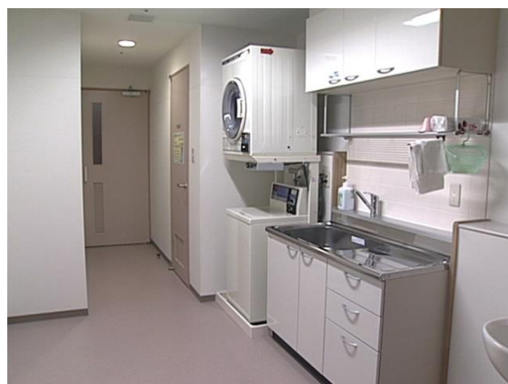
病棟洗濯コーナー