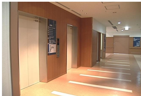
エレベーターホール