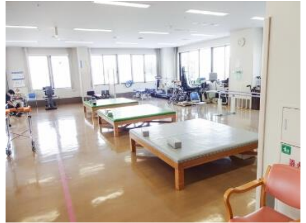
リハビリテーションセンター