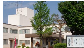
上富良野町立病院

当院と旭川医科大学病院とのたすきがけ研修(逆たすきがけ研修も)が可能です。例えば、1年次は旭川医大病院で内科、救急、麻酔科などの研修を行い、2年次に当院の自由度の高いプログラムを活用して希望の科の臨床力を磨くこともできます。