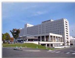
旭川医科大学病院

内海内科クリニック 北海道富良野保健所 介護老人保健施設ふらの 上富良野町立病院