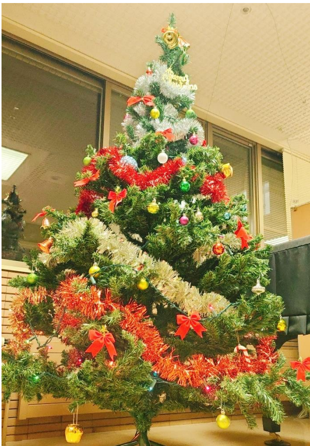
クリスマスツリー

そのためにもまずかかりつけの歯科医院へ行き、しっかりお口の中を清掃してもらいましょう。もちろんご自身でする歯磨きも大事ですが 歯科医院で行われる機械的清掃も必要 なのです。さあ皆さん！歯医者に行きましょう！GO！GO！歯医者です！